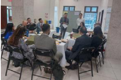
Imagen de los Talleres realizados en el proceso de creación de la Política de Resolución Alternativa de Conflictos.

"Se requería de una herramienta institucional que permitiera el establecimiento de objetivos claros, uniformes y acorde a las necesidades actuales de las personas usuarias y los retos de la institución en esta materia, para la articulación institucional y el desarrollo de planes de trabajo que procuren priorizar e incentivar estos servicios y que permita a las personas contar con una respuesta oportuna, pacífica y satisfactoria de una forma celeré, lo cual tiene un impacto positivo en el rezago judicial", menciona Duarte Acuña.