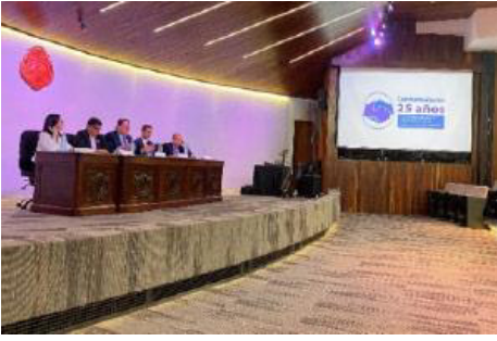
La Ley de Resolución Alternativa de Conflictos y Promoción de la Paz Social, Ley 7727 en Costa Rica cumplió 25 años en este 2023.

Los mecanismos RAC en Costa Rica son una iniciativa que surge del Poder Judicial a partir del año 1990, en donde se presenta la idea de promover la sistematización del Instituto de la Conciliación, con el fin ofrecer a las personas usuarias una alternativa pacífica y dialogada de resolver su conflicto.